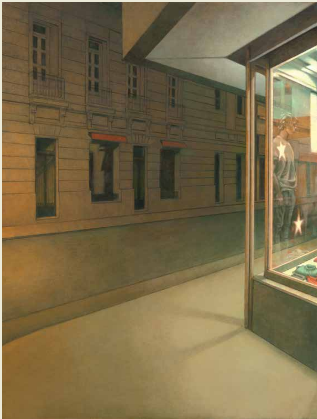
Esquina óleo sobre tela 90 x 120 cm