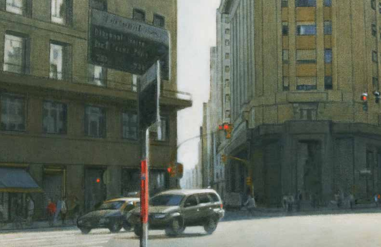
Cruce, óleo sobre tela - 50 x 70 cm

Inauguración: Miércoles 29 de mayo 2013 | 19 hs.