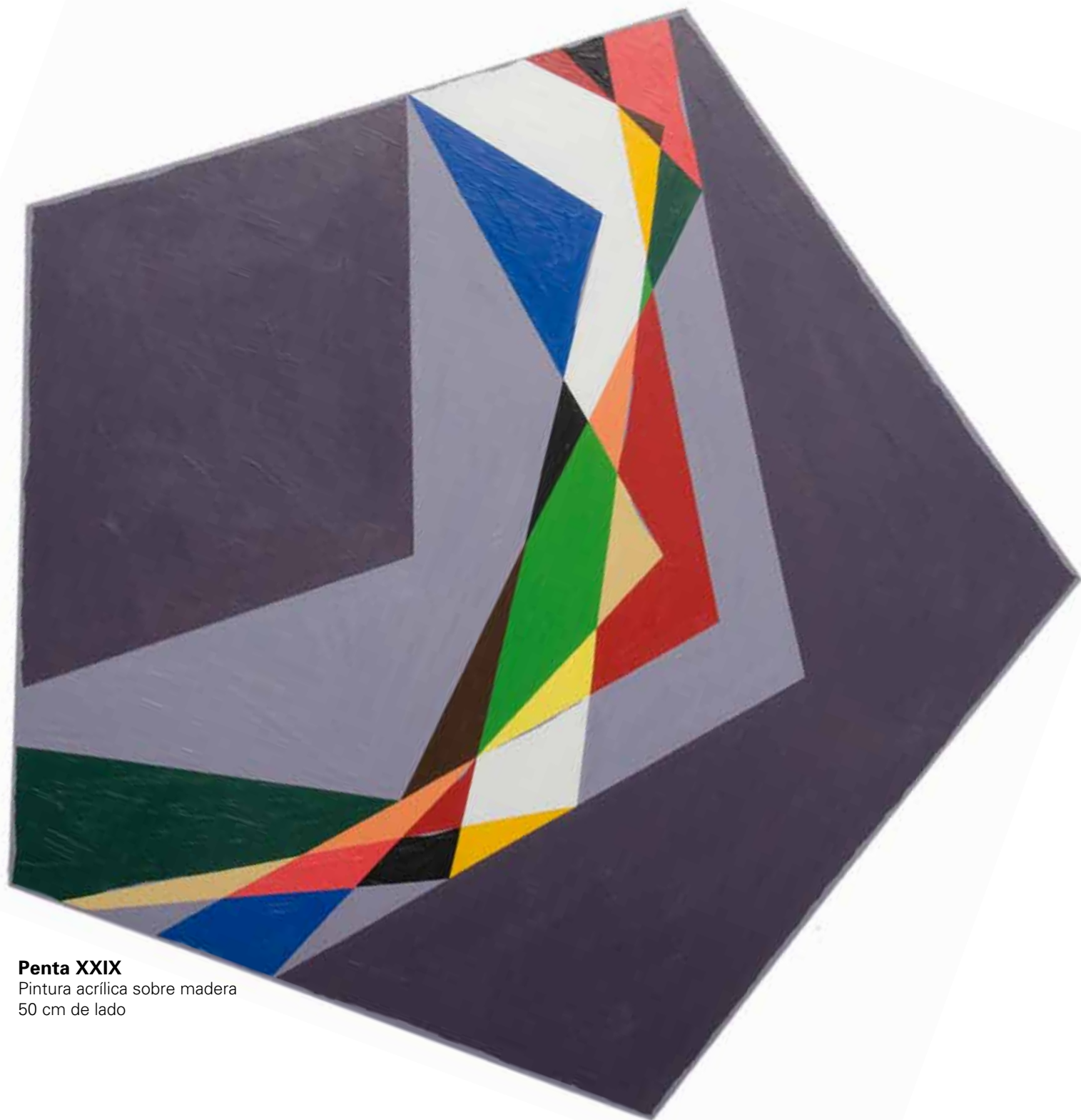
Penta XXIX Pintura acrílica sobre madera 50 cm de lado