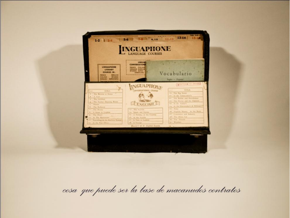
cosa que puede ser la base de macanudos contratos