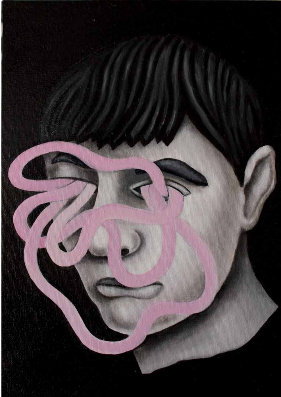
Nesy Cohen Sin título - óleo sobre tablilla entelada 33x22cm (2013)