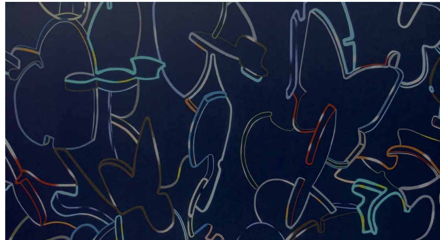
Pablo Lozano Sin título - Acrílico sobre tela 75x130 cms - (2012)