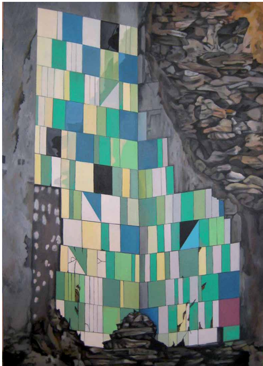
Sergio Vila Epidermis Urbana Óleo sobre tela. 145 x 97 cm (2010)