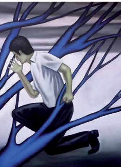
Nesy Cohen Blue Note - Óleo sobre tela 81 x 65 cm. (2011)