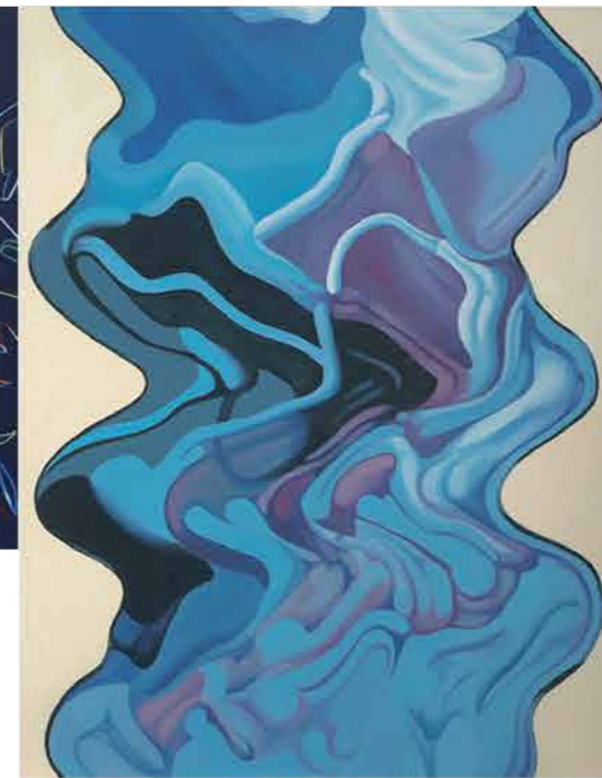
Sergio Vila Silla en el agua Acrílico sobre tela. 115x162 cm (2010)