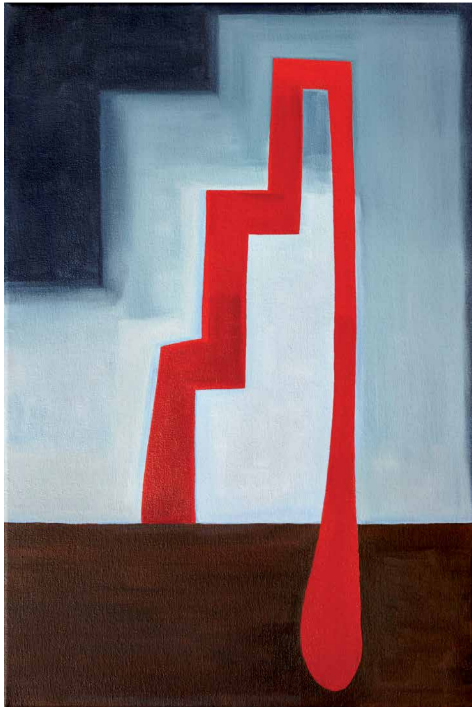
Magdalena Jitrik Sin título - Óleo sobre tela 60 x 40 cm - (2013)