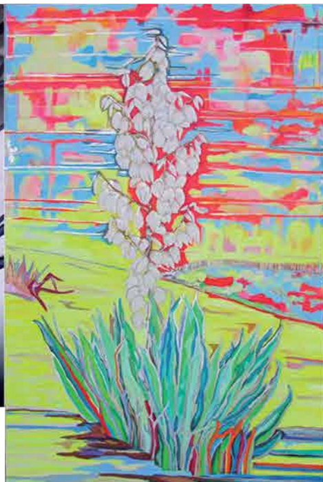
Claudia Haber Cae el sol en Playa Mansa Acrílico sobre tela 120 x 80 cm. (2013)