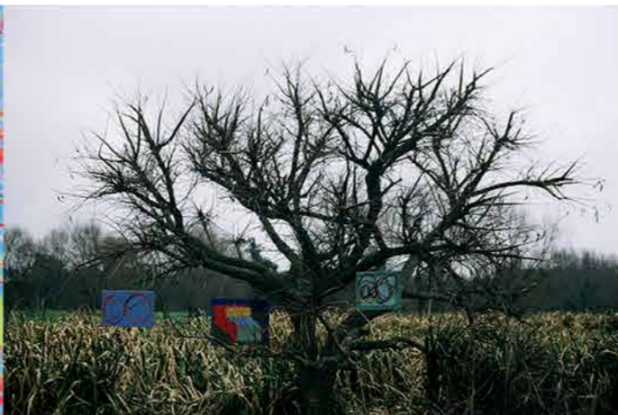
Magdalena Jitrik Árbol de cuadros/Punta Lara, fotografía 35 mm 42 x 52 cm. (2012)