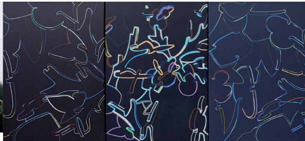
Pablo Lozano Sin título Acrílico sobre tela 70 x 150 cm. (2009)