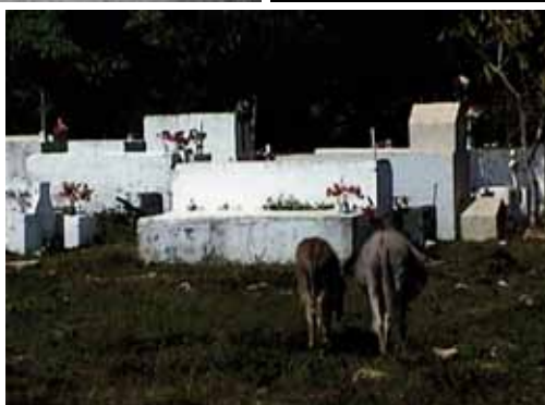
Hacer el sacrificio , 2011 Video 11 min. Edición: 3 + 1AP