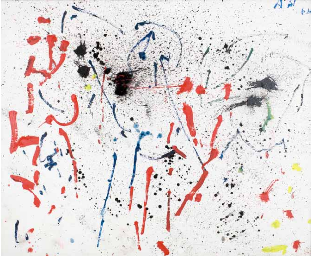
UNIVERSO • óleo sobre tela • 165 x 200 cm • 2008