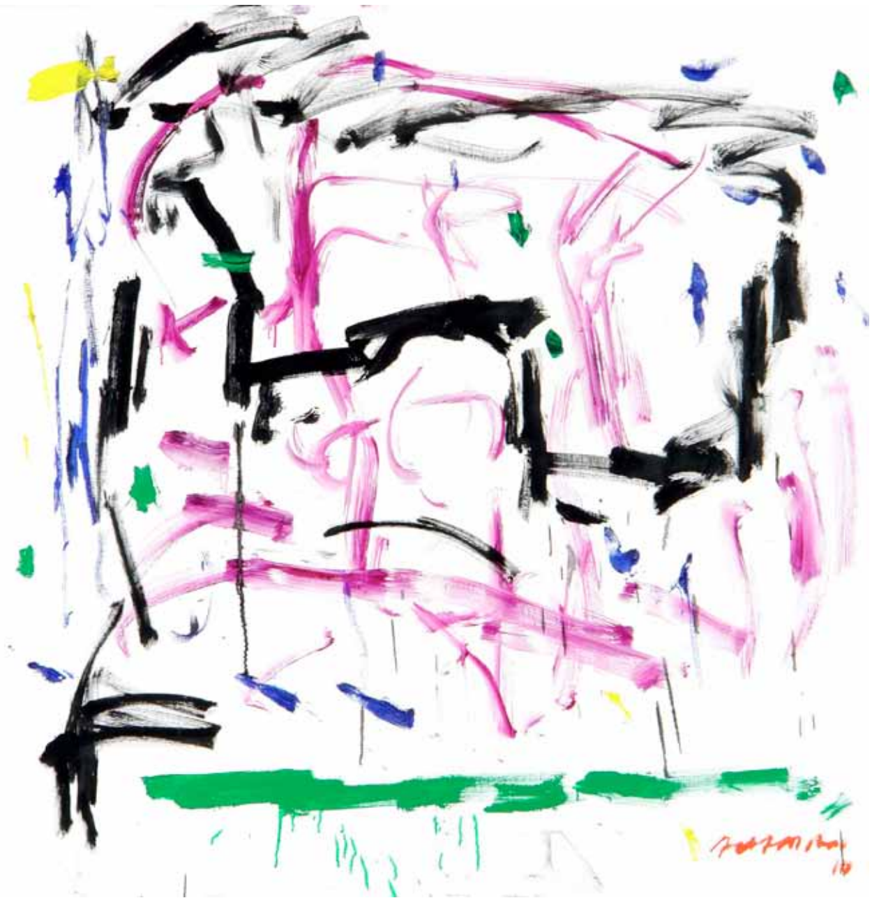
YESI Y LOLA • óleo sobre tela • 130 x 130 cm • 2010