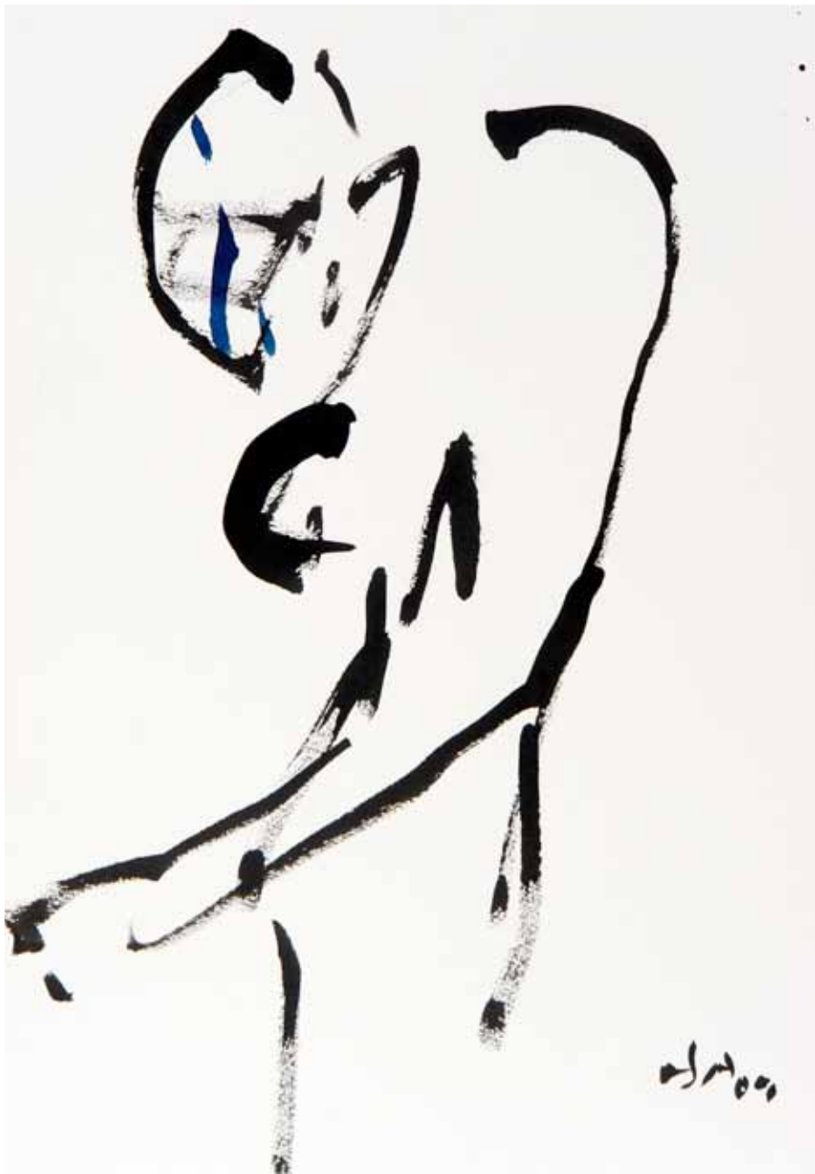
SIN TÍTULO • tinta sobre papel • 50 x 35 cm • 2009