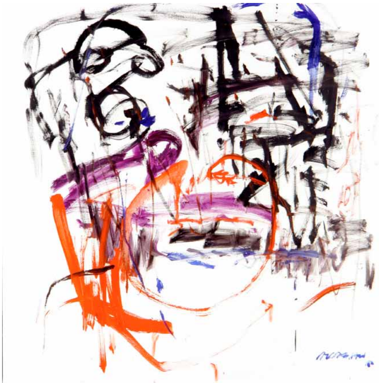
RETRATO • óleo sobre tela • 130 x 130 cm • 2010