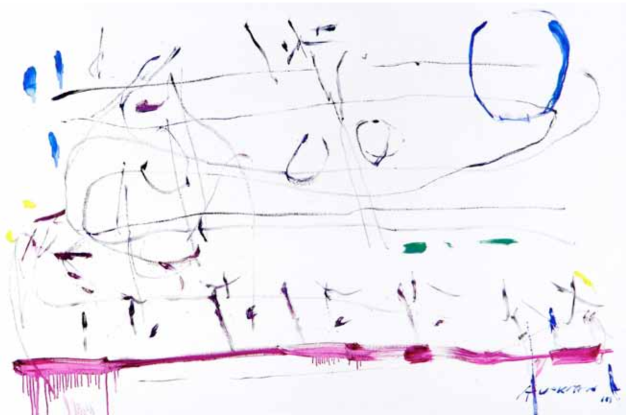
CELINA • óleo sobre tela • 113 x 170 cm • 2010