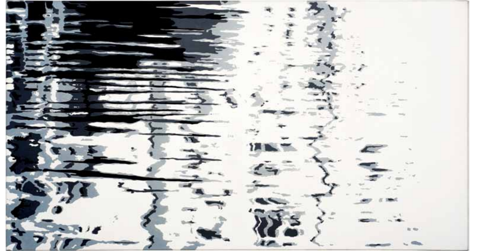
Superficie I Pintura acrílica sobre tela 80 x 150 cm