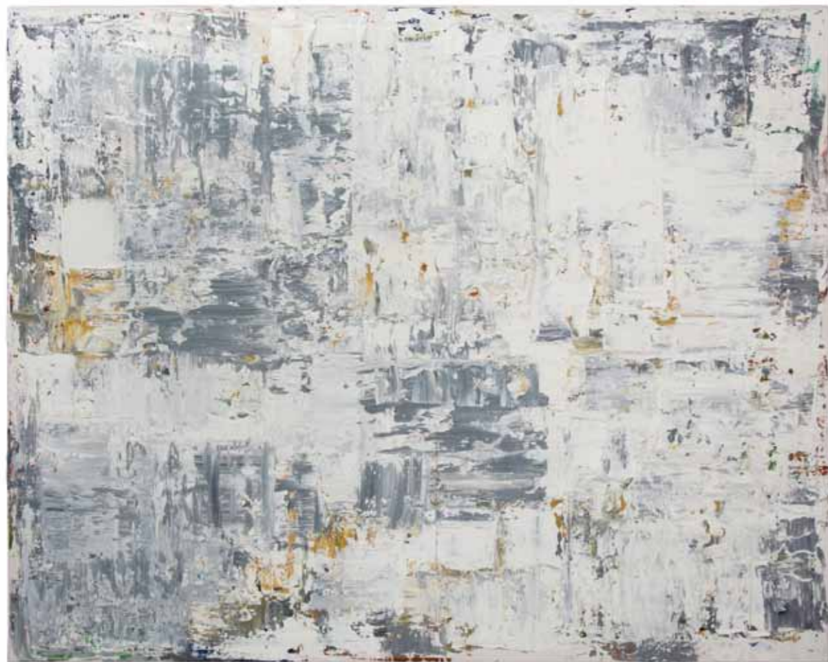
Gestual XXIX Óleo sobre tela. 80 x 100 cm