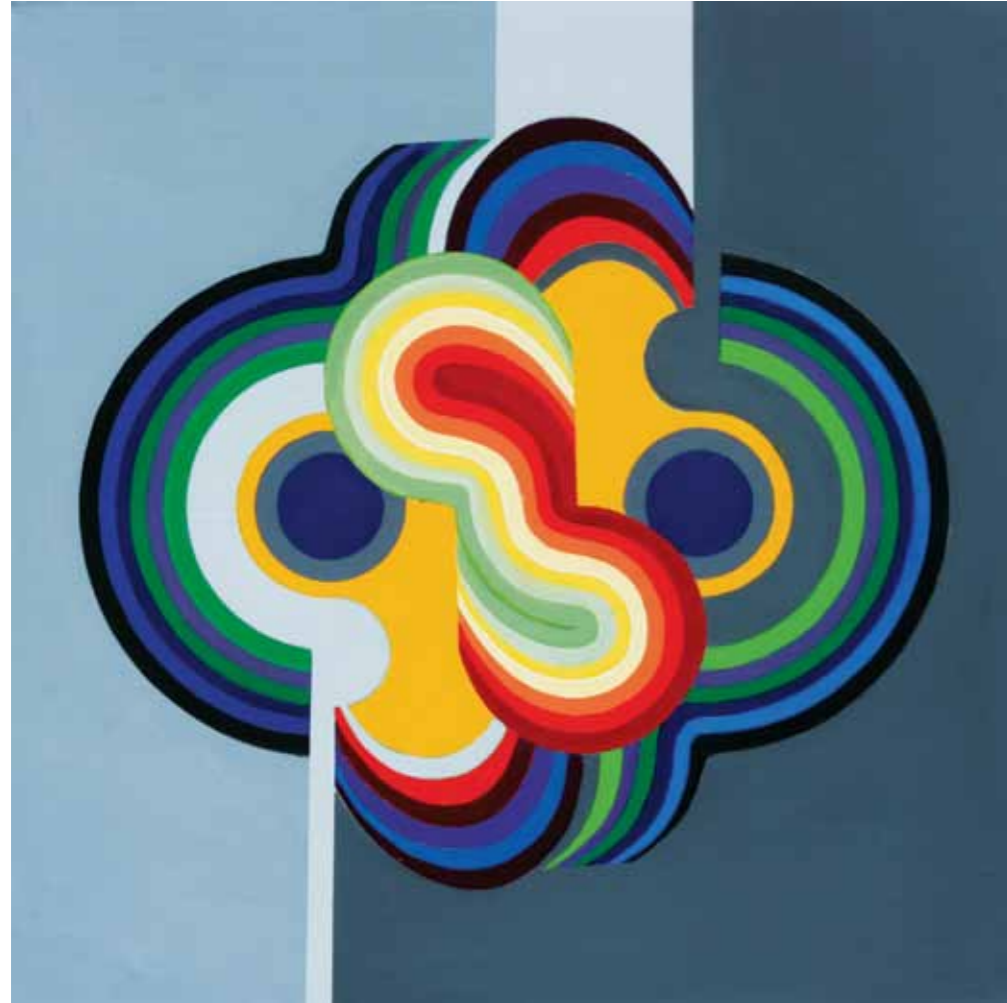
Composición IV Pintura acrílica sobre tela 100 x 100 cm