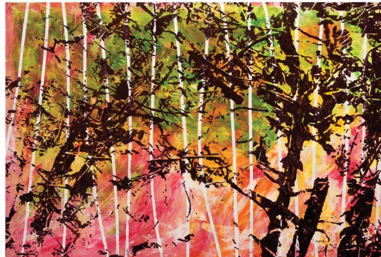
Serie Vegetal XII Pintura acrílica sobre film transparente 101 x 150 cm