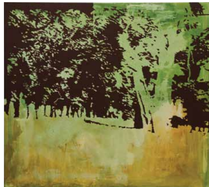
Isabel Pungitore Paisaje I Pintura acrílica sobre tela 90 x 120 cm