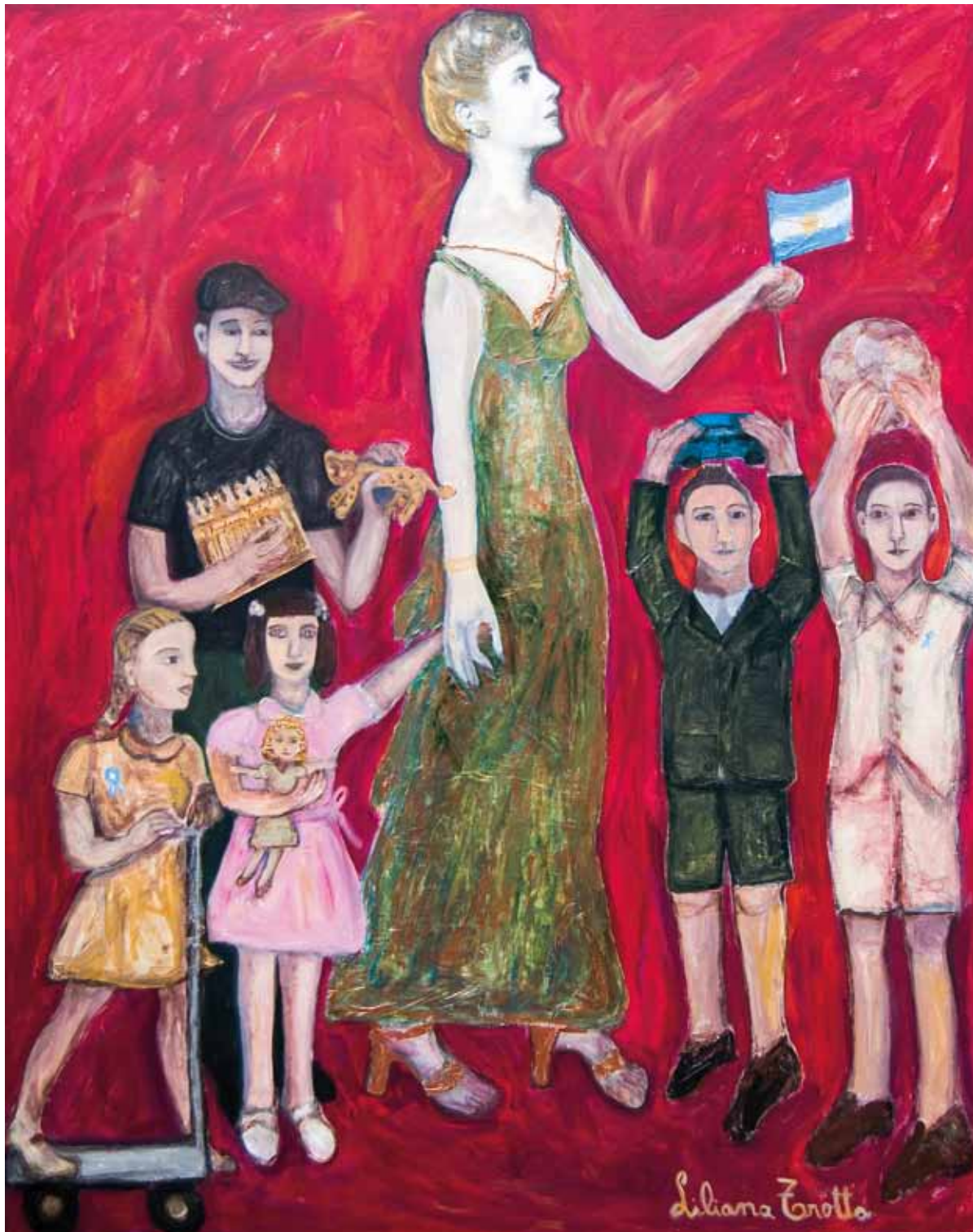
“Evita en la Fundación” Técnica Mixta 190x170 cm - 2006