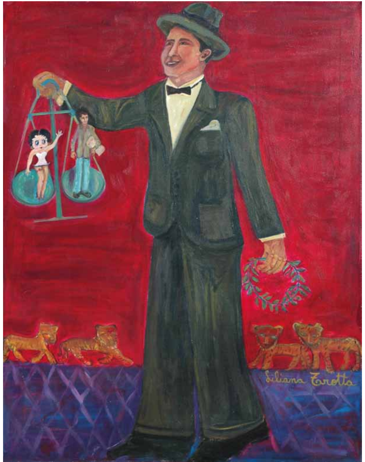
“El día que Betty Boop conoció a Gardel”