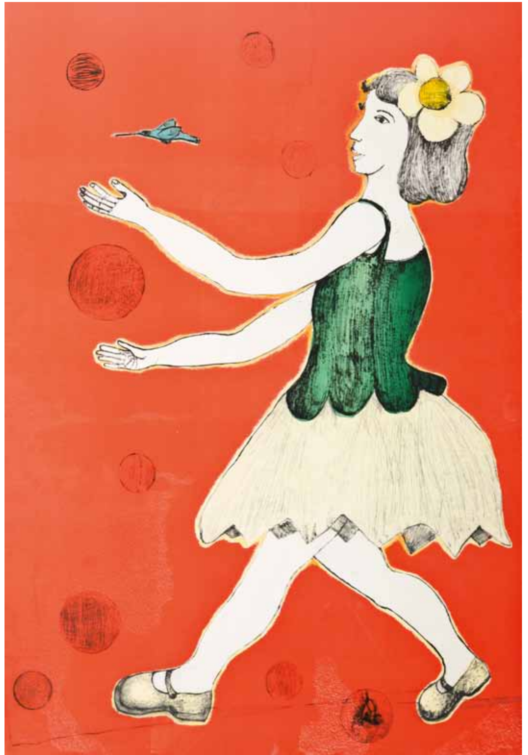
Margarita "Como pompas de jabón" Punta seca 100 x 70cm - 2010