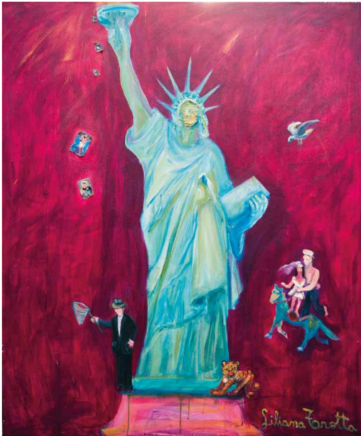
“Los equilibristas con estatua” Acrílico y collage 120x100 cm - 1995