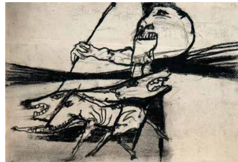
Los Chocos. 22 x 33. Mixta sobre papel. 1964