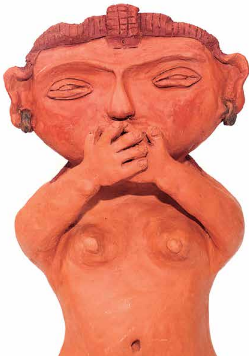
De esto no se habla (detalle) Téc. Cerámica 40 x 25 x 20cm. / 2017