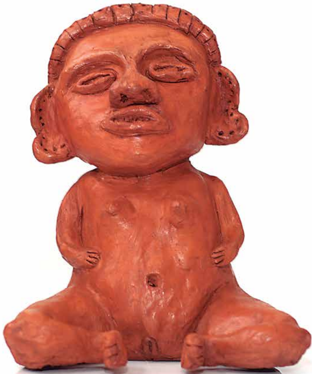
Bella Téc. Cerámica 30 x 20 x 20cm 2017