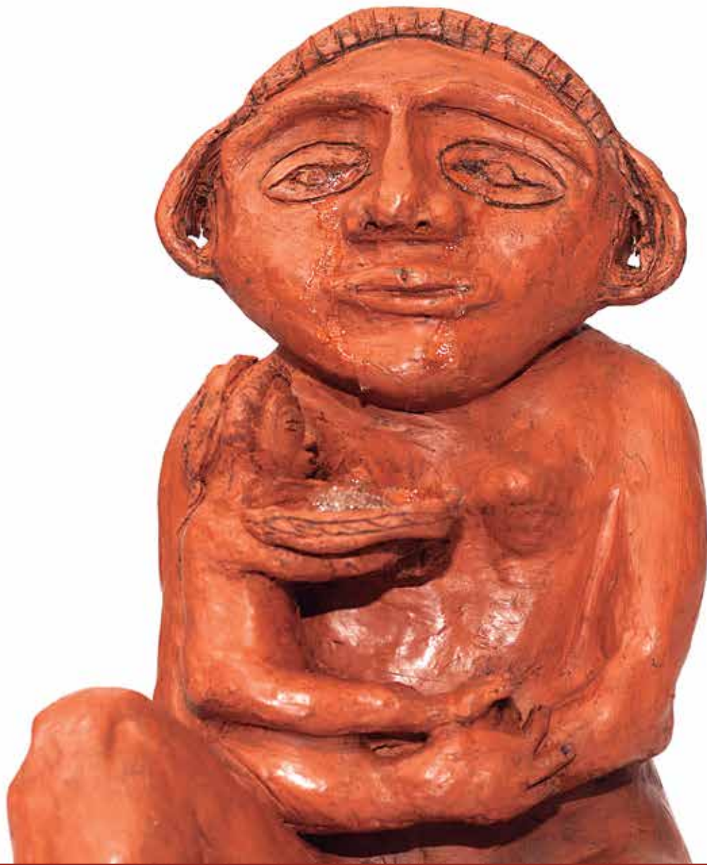
Llorar y echar raíces (detalle) Téc. Cerámica 35 x 30 x 25cm. / 2017